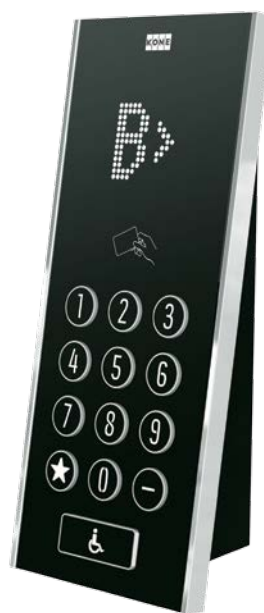
Rys. 1 Panel DOP Kone Polaris KSP 853

Firma Inner Range przygotowuje też kolejną interesującą funkcję: blokowania możliwości wjazdu na piętro, które jest zabezpieczone uzbrojonym systemem alarmowym sygnalizacji włamania. Osoba nieposiadająca uprawnień do rozbrajania systemu nie będzie mogła