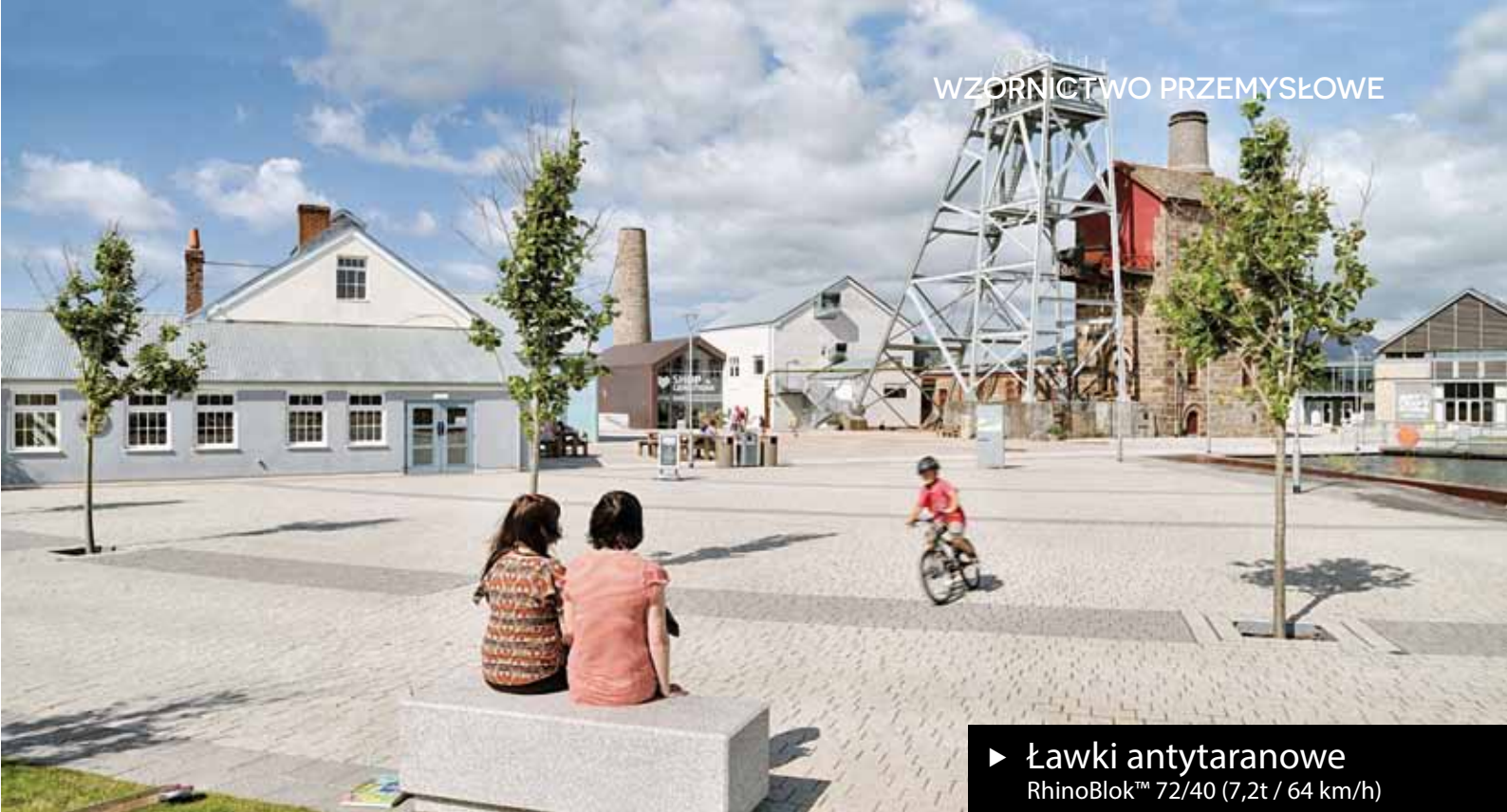
▶ Ławki antytaranowe RhinoBlok™ 72/40 (7,2t / 64 km/h)