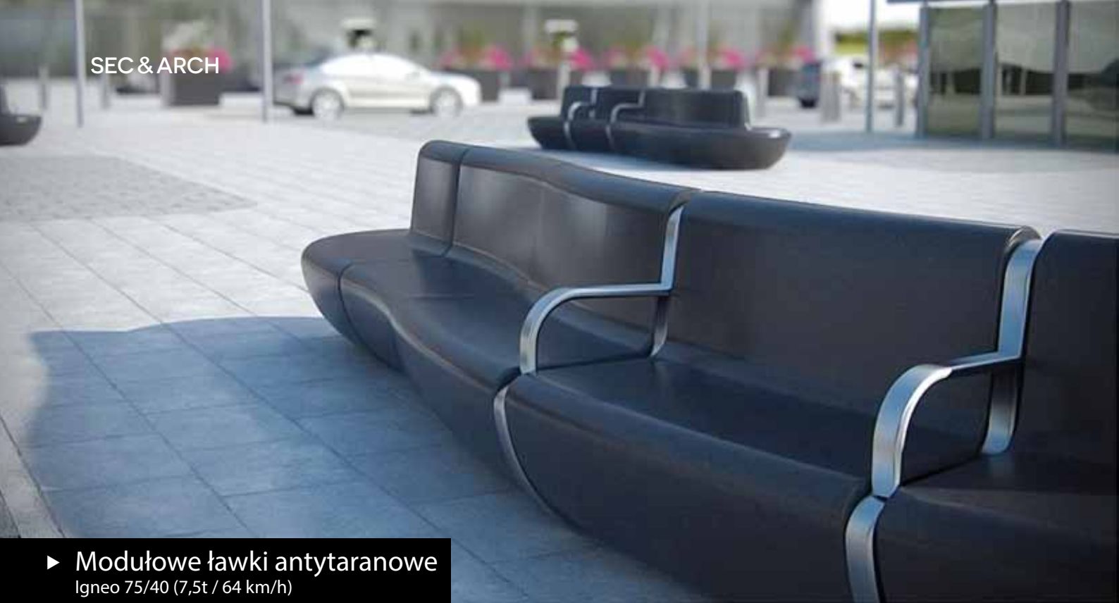
► Modułowe ławki antytaranowe Igneo 75/40 (7,5t / 64 km/h)