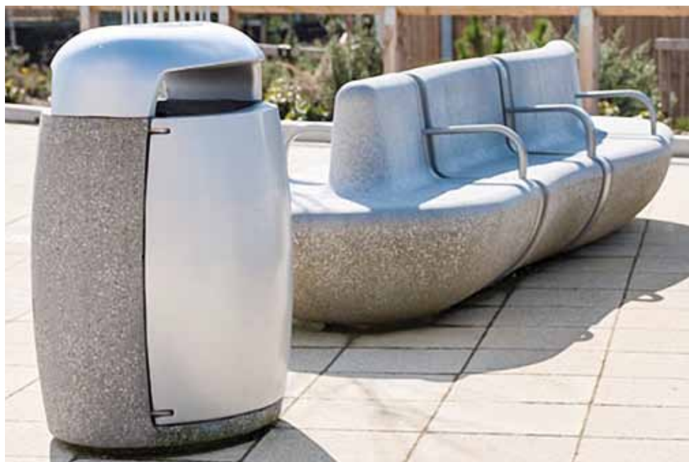
Łącznik modułów żelbetonowych oraz kosz na śmieci Igneo