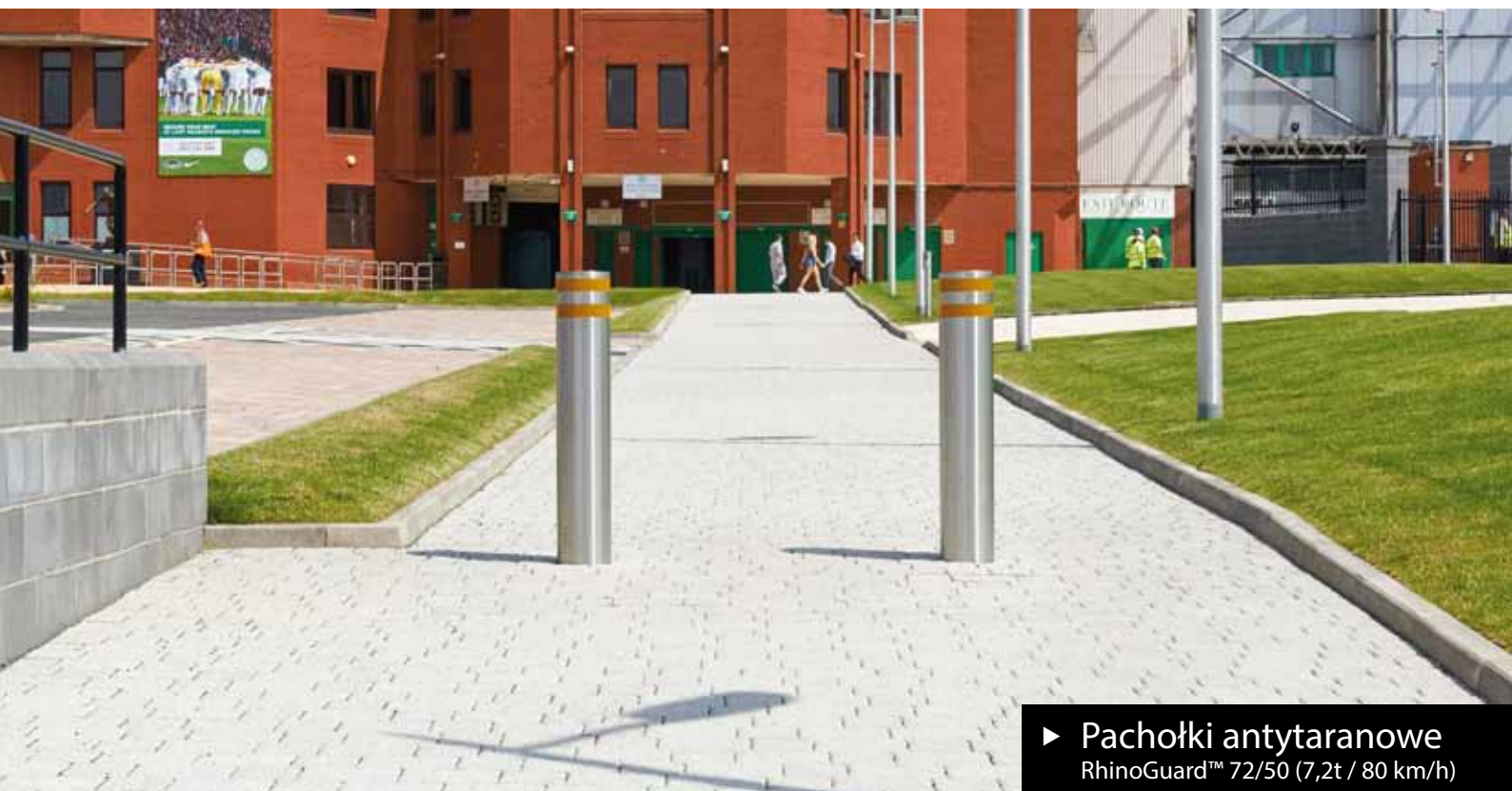
► Pachołki antytaranowe RhinoGuard™ 72/50 (7,2t / 80 km/h)