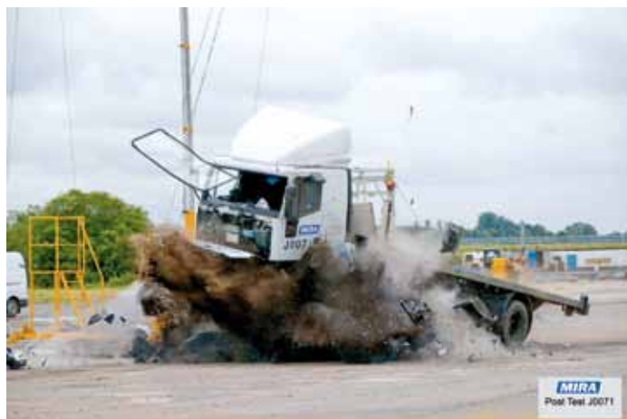
Test najazdowy donicy RhinoGuard™ 75/50 (ciężarówka o masie 7,5t nadjeżdża z prędkością 80 km/h)