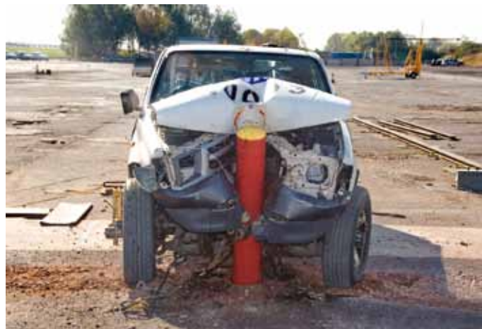
Pachołki w mieście i w czasie testów najazdowych