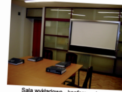
Sala wykładowo - konferencyjna