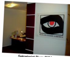
Sekretariat Biura PISA