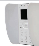
INTG-999059P Osłona ochronna na Klawiaturę Prisma – Biała