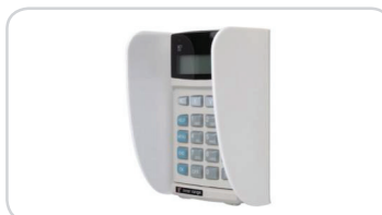
999059 Osłona ochronna na klawiaturę Elite - Biała