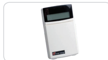
995000MLWH Uniwersalna klawiatura Elite (wielojęzyczna, biała)