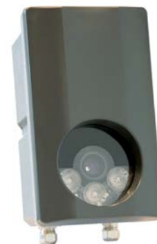
Rys. 5. System rozpoznawania tablic rejestracyjnych ANPR

Jednoczesna identyfikacja pojazdu za pomocą rozpoznawania tablic rejestracyjnych (system ANPR) i kierowcy za pomocą czytnika pracującego w pasmie UHF, odczytującego podwójne karty służące do identyfikacji i na wjeździe, i w budynkowym systemie kontroli dostępu – tak wyrafinowany system został przygotowany dla jednego z warszawskich biurowców. Wykorzystano istniejący system z czytnikiem rozpoznawania tablic rejestracyjnych ANPR (Automatic Number Plate Recognition). Przykładowe urządzenie realizujące funkcje ANPR pokazano na rys. 5 (ANPR Access