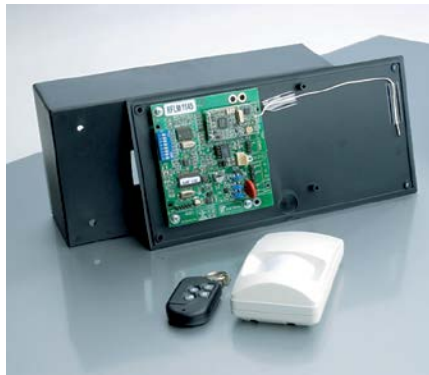
Rys. 1. Moduł RF Expander firmy Inner Range obsługujący piloty i czujki bezprzewodowe firmy Visonic

tym na technologii Cotag, jest umieszczenie identyfikatorów wykonanych w formie przypominającej brelok, wewnątrz lusterek samochodów służbowych. Mamy wówczas do czynienia z identyfikacją pojazdów przejeżdżających obok czytnika. Zdumieni kierowcy