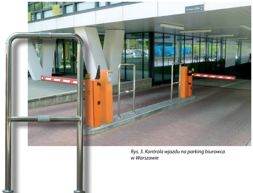
Rys. 3. Kontrola wjazdu na parking biurowca w Warszawie

tym na technologii Cotag, jest umieszczenie identyfikatorów wykonanych w formie przypominającej brelok, wewnątrz lusterek samochodów służbowych. Mamy wówczas do czynienia z identyfikacją pojazdów przejeżdżających obok czytnika. Zdumieni kierowcy