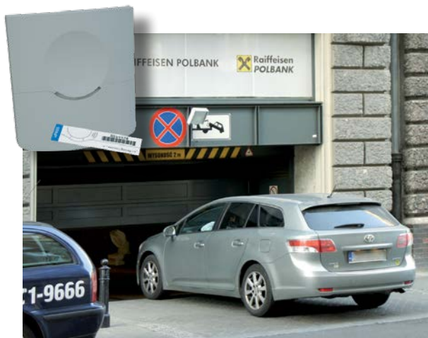
Rys. 4. Czytnik oraz pasywna naklejka działające w pasmie UHF oraz kontrola wjazdu do biurowca w Warszawie

Zasięg czytnika pasywnych kart UHF nie przekracza 2 m przez szybę boczną pojazdu,